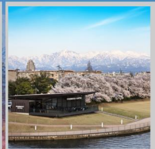
“TOYAMA KANSUI PARK”