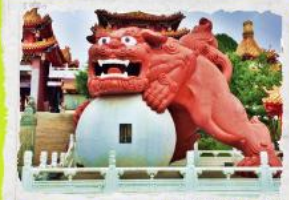
วัดเขวี่งหวู่