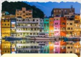
ทะเลสุริยขึ้นฉันทารา