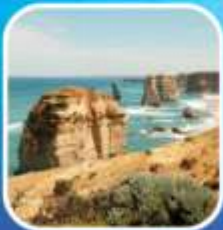
Great Ocean Road (ครึ่งสาย)