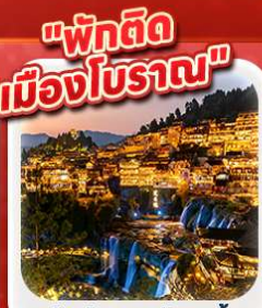
"เมืองโบราณฟู่หลงเจิ้น"