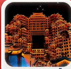
"ตึกมหัศจรรย์ 72 ชั้น"