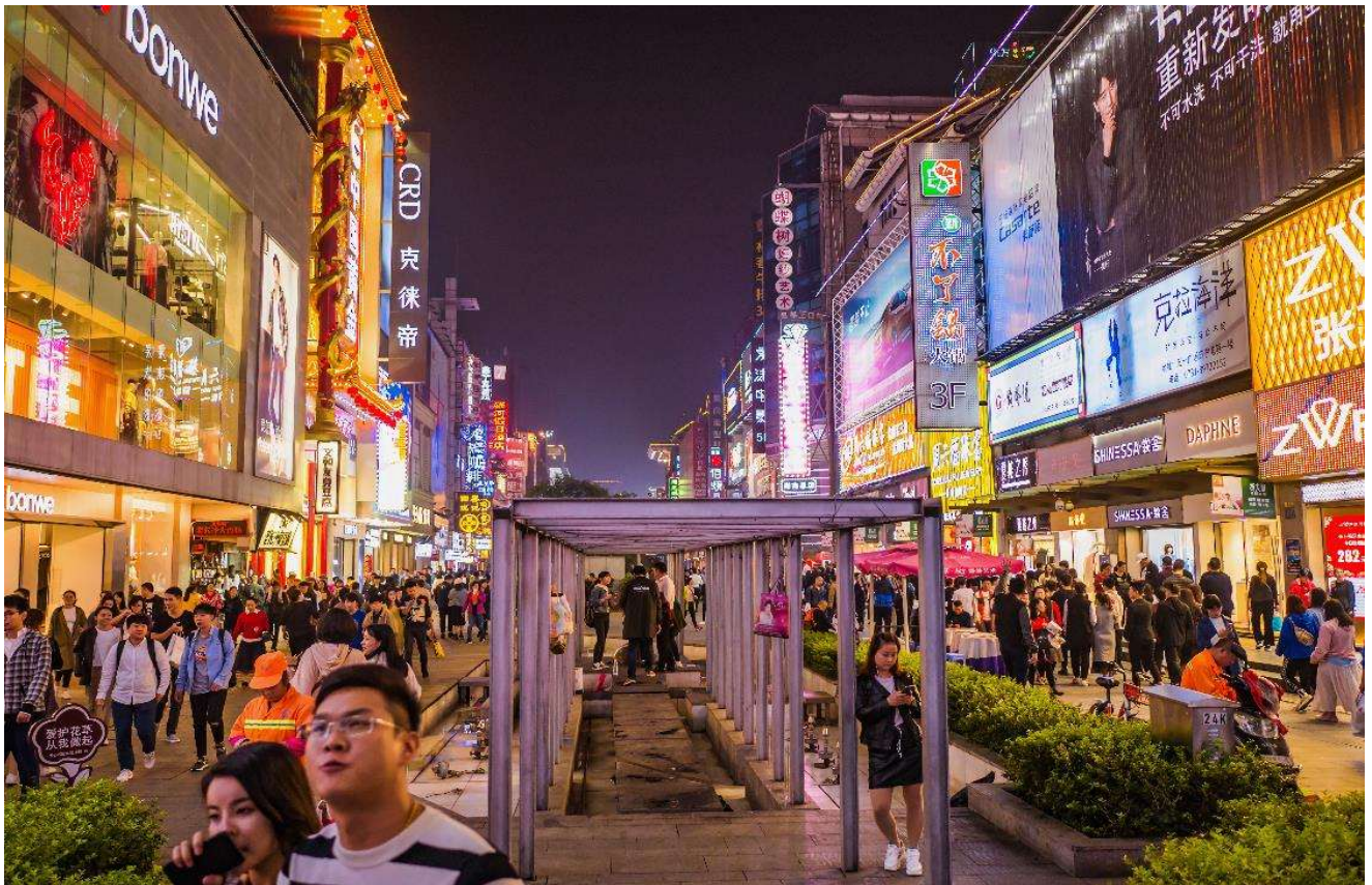
T2G-CSX16SL ZhangJiajie...ฉางซา จางเจียเจีย ฟู่หลงเจิ้น เฟิ่งหวง สะพานแก้ว 6D 5N (SL)