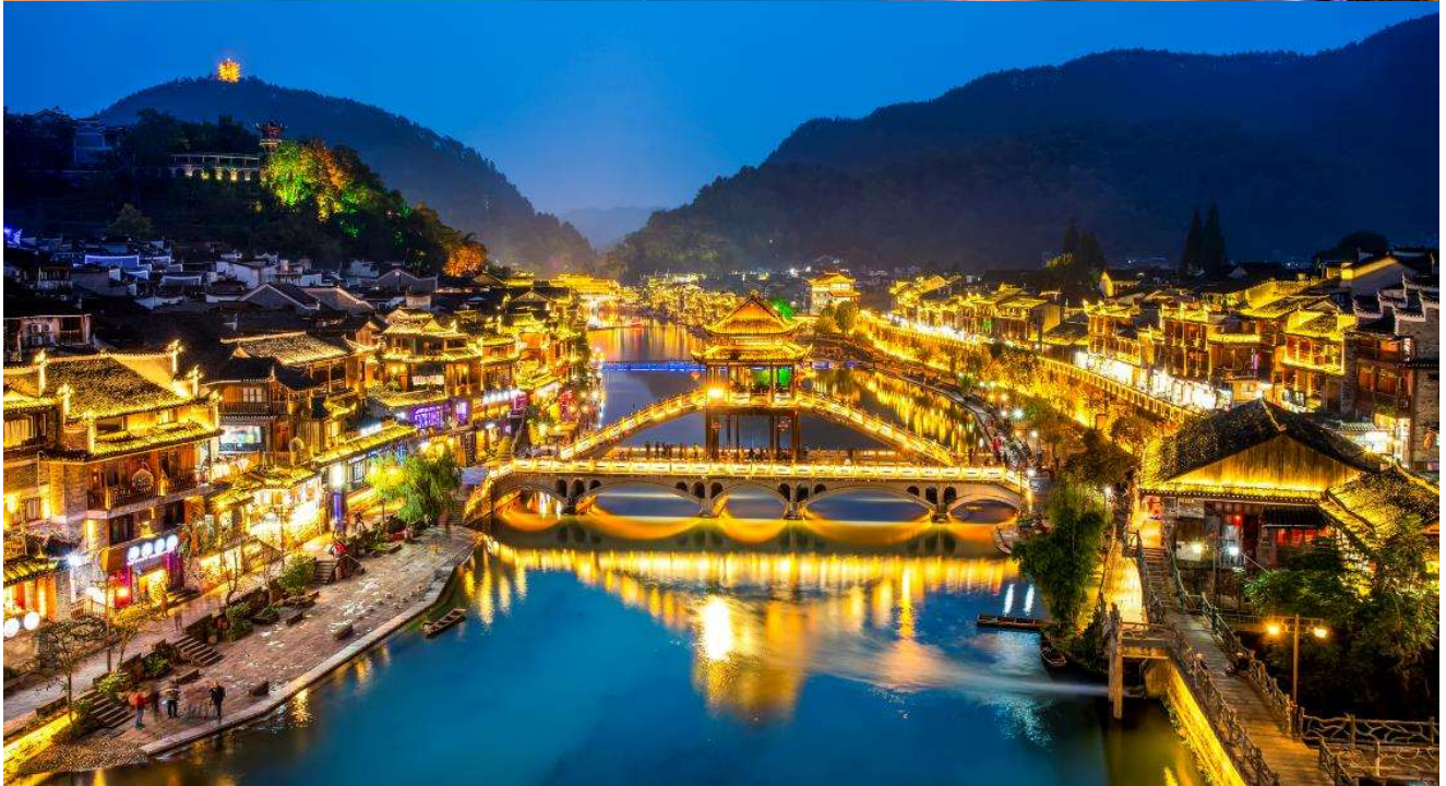
T2G-CSX16SL ZhangJiaJie...ฉางซา จางเจียเจีย ฟู่หลงเจิ้น เฟิ่งหวง สะพานแก้ว 6D 5N (SL)