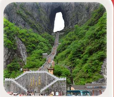
"กำแพงแก้ว"