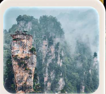
"หุบเขาอวตาร"