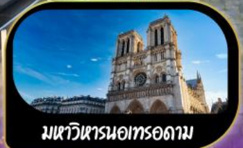
มหาวิหารนอทรอดาม