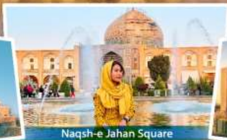
Naqsh-e Jahan Square