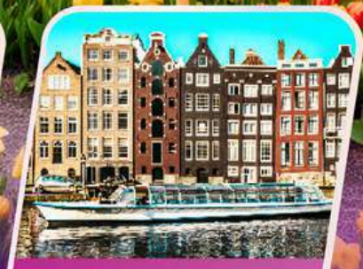
ล่องเรือหลังคากระຈก