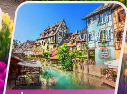
เที่ยวแคว้นอาลซัส