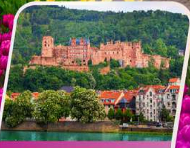
เข้าชมปราสาทไฮเดิลเบิร์ก