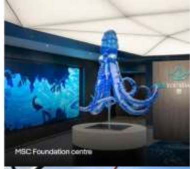
MSC Foundation centre