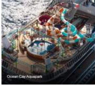
Ocean City Aquapark