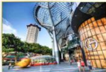
• Orchard Road